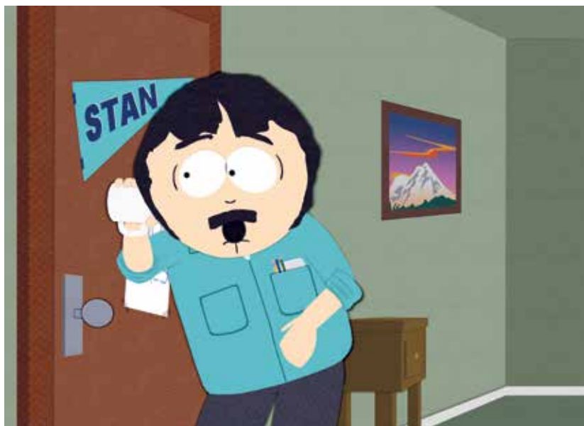
Bild ovan: Geologen Randy Marsh från South Park. Tabell 1, till höger: Amerikanska och brittiska biofilmer med geologer i rollistan.

Vi har därför försökt att hitta så många filmer med geologer som möjligt. Vi har koncentrerat oss på amerikanska och brittiska filmer som någon gång har visats i biograf. Det finns också minst tre svenska filmer med geologer "Ådalens